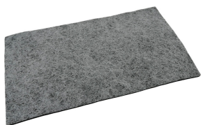
PREFILTRO HELLMET FLOW