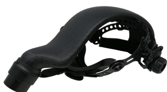
ARNES HELLMET FLOW