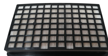
FILTRO PRINCIPAL TH3P HELLMET FLOW