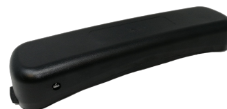
BATERIA HELLMET FLOW