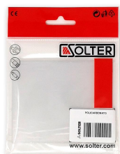
POLICARBONATO 117,8x136,5 EXTERIOR HELLMET XL (5Un)