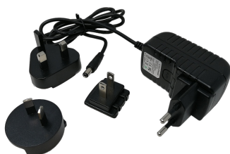
CARGADOR HELLMET FLOW