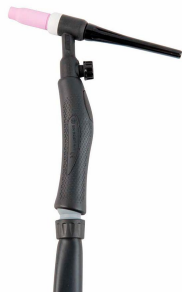
ANTORCHA 4M TIG SR17V