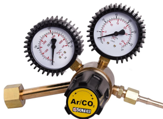
REGULADOR R25 AR/CO2