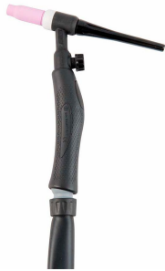
ANTORCHA 4M TIG SR17V D10/25 Ref. 06024