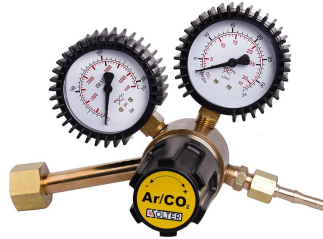
REGULADOR R25 AR/CO2 Ref. 56246