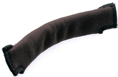
SUDADERA OPTIMATIC / HELLMET / CABEZA