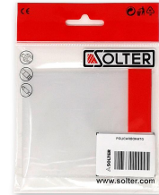
POLICARBONATO 108.7x105.2 INTERIOR (5Un)