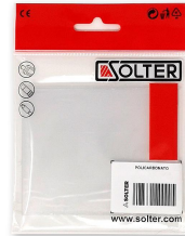
POLICARBONATO 117,8x136,5 EXTERIOR HELLMET XL (5Un)