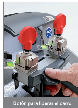
Botón para liberar el carro