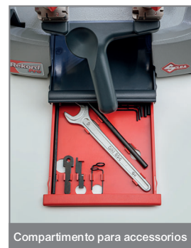
Compartimento para accesorios