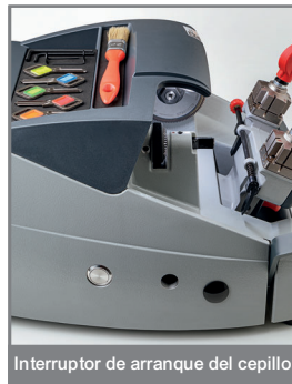
Interruptor de arranque del cepillo

Para mayor seguridad, el motor de la fresa funciona solo durante la operación de corte de llaves. La fresa arranca automáticamente cuando se levanta la palanca del carro y se detiene automáticamente cuando se