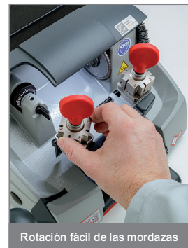
Rotación fácil de las mordazas

suelta la palanca. No es necesario presionar un botón de encendido/apagado y no hay riesgo de que la fresa se deje encendida accidentalmente.