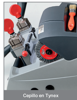
Cepillo en Tynex

El cepillo para eliminar las rebabas de la llave tras el cifrado está realizado en tynex y se activa mediante el botón de arranque de la fresa.